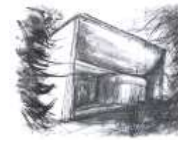
SS. Filippo e Giacomo