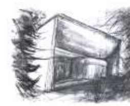
SS. Filippo e Giacomo